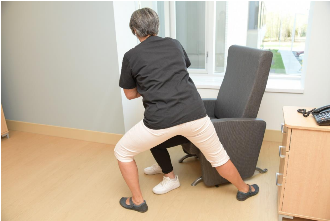
Effectuer le transfert de poids latéral En entraînant la personne à pivoter vers l'avant et l'horizon