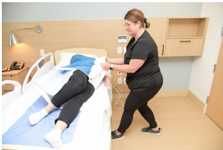
Faire un transfert de poids avant-arrière pour tourner la personne, garder les coudes près du corps