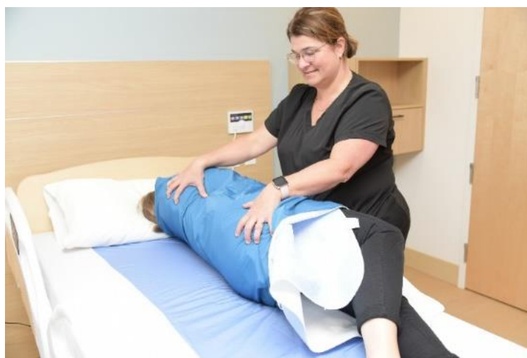
Éviter de faire la prise en griffe