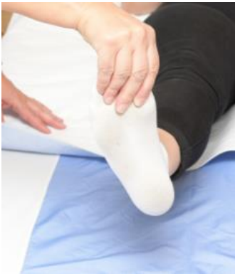
Prise en pince