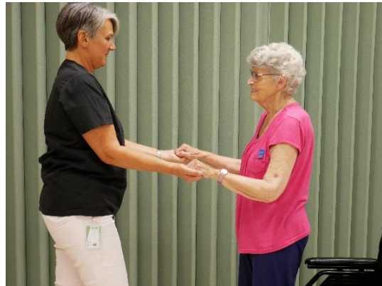
Du bout des doigts pour stimuler une personne à se lever d'un fauteuil