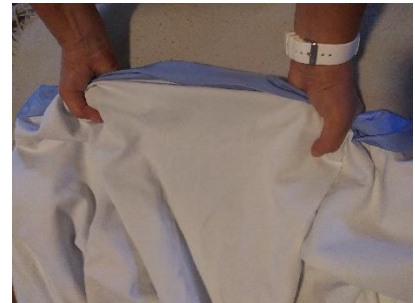
Paumes vers le haut