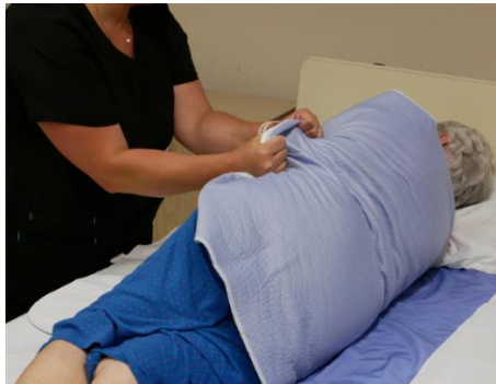
Pouces vers le haut