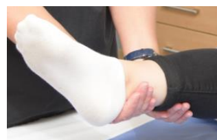
Prise supportante pour déplacer un membre