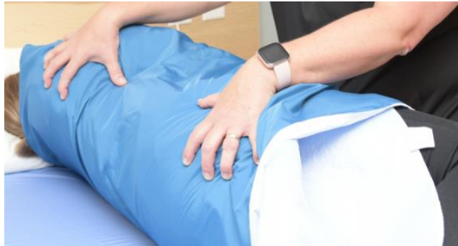
Prise en griffe