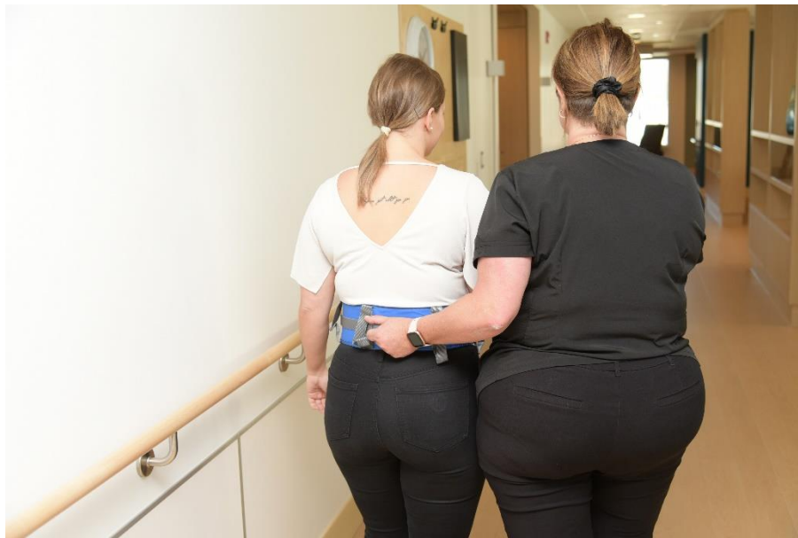
Stimuler la personne à marcher en poussant vers l'avant et en maintenant la ceinture