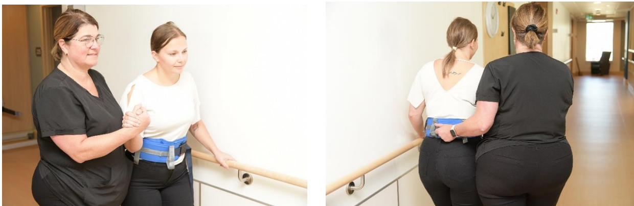
La personne peut se tenir aussi sur la main courante