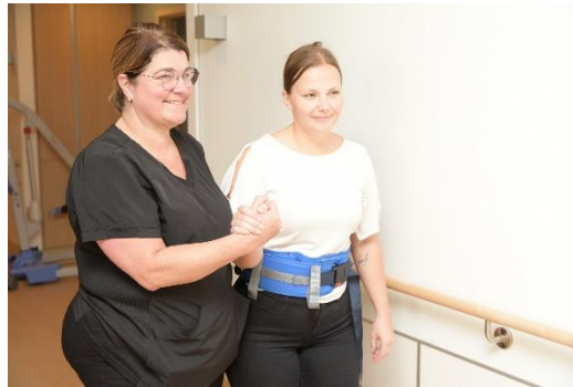
Utiliser la ceinture de marche et la prise pouce, parallèle à la personne