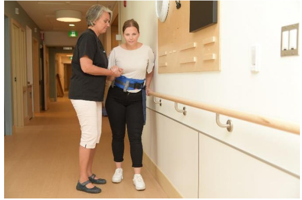
Prise pouce, ceinture de marche et main courante en perpendiculaire à la personne