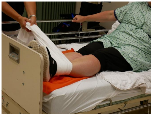
En gardant l'alèse au niveau de la cheville, se déplacer de l'autre côté du lit pour centrer les jambes en les glissant sur la surface de glissement par transfert de poids avant-arrière