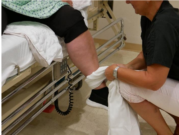
Le soignant s'accroupit pour aller chercher l'autre jambe avec l'alèse au niveau de la cheville