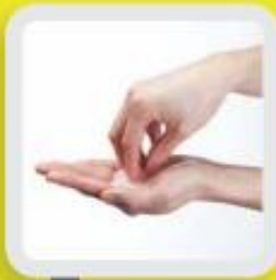
4 NETTOYER LES ONGLES