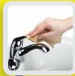
7 FERMER AVEC LE PAPIER