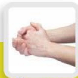
3 FROTTER DE 15 À 20 SECONDES