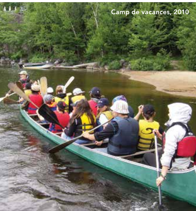
Camp de vacances, 2010