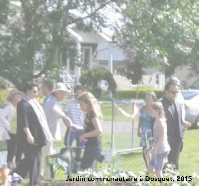
Jardin communautaire à Dosquet, 2015